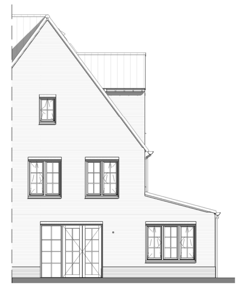
ACHTERGEVEL 1 : 100