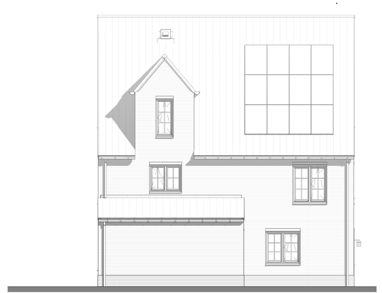
RECHTERGEVEL 1 : 100