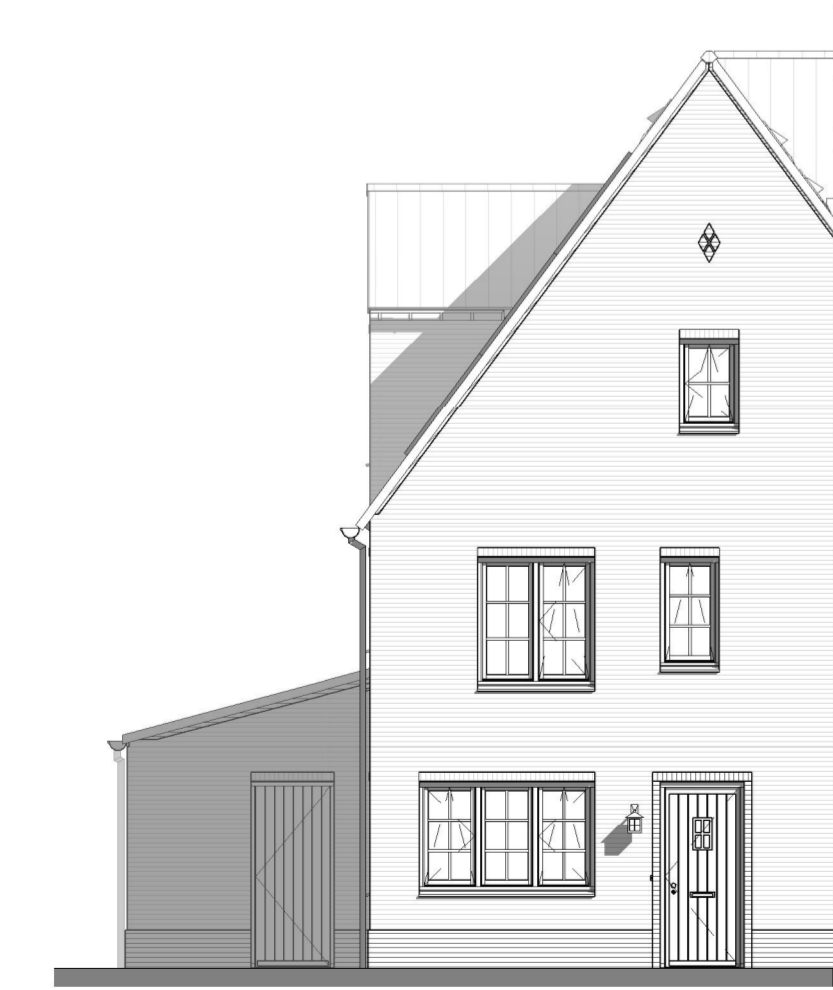
VOORGEVEL 1 : 100