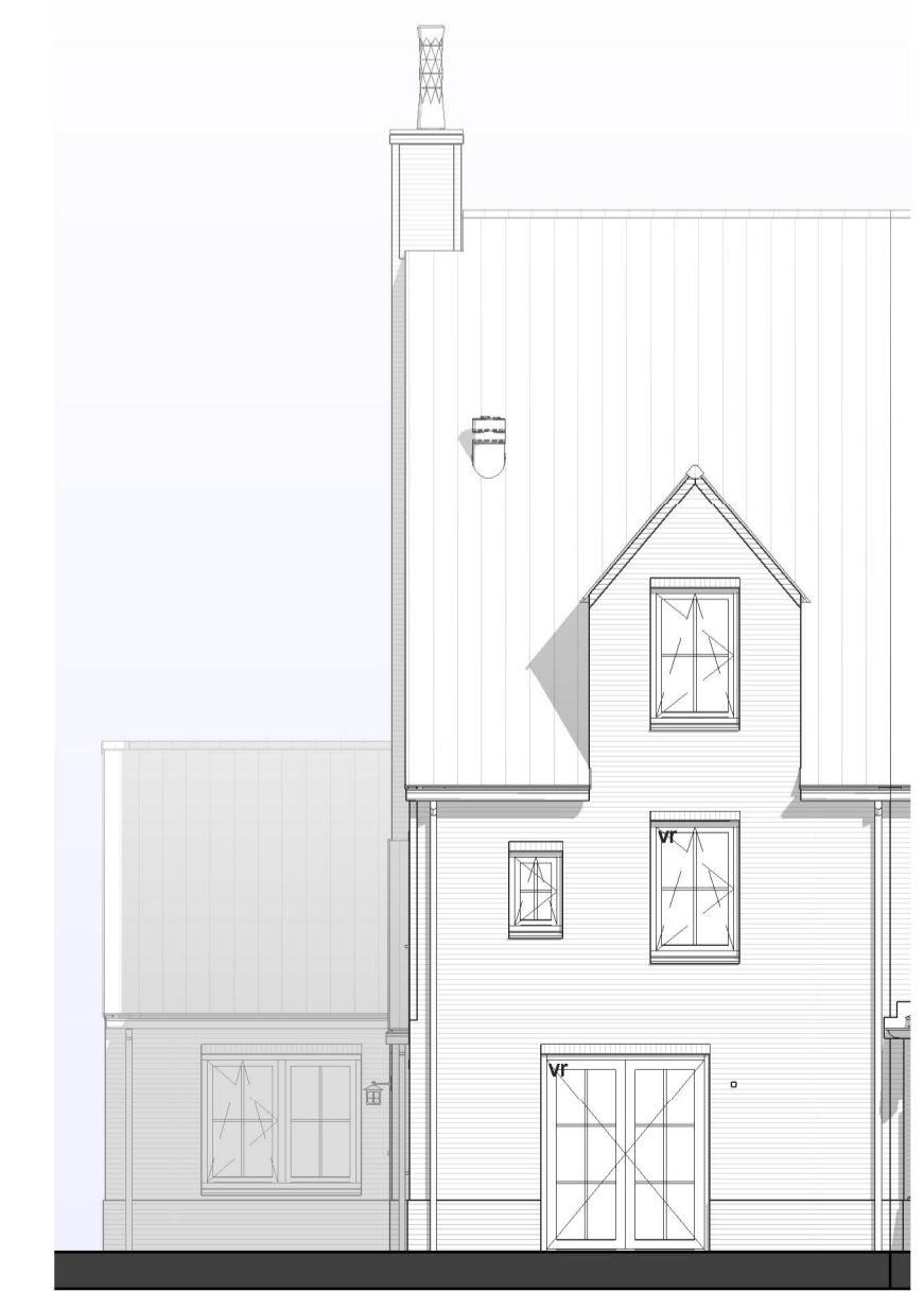
DERDE VERDIEPING 1 : 50