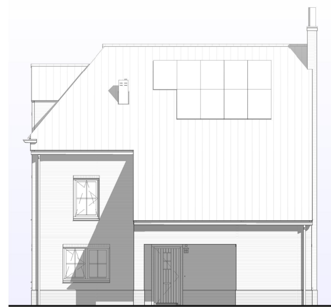
RECHTERGEVEL 1 : 100