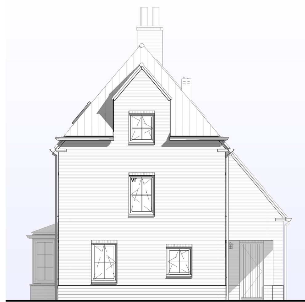
VOORGEVEL 1 : 100