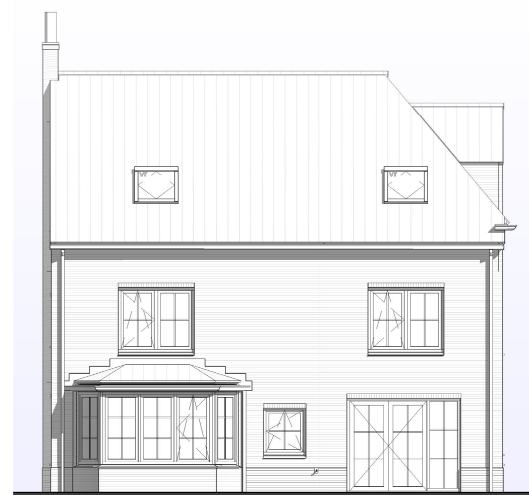
LINKERGEVEL 1 : 100