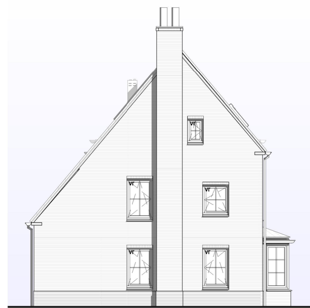
ACHTERGEVEL 1 : 100